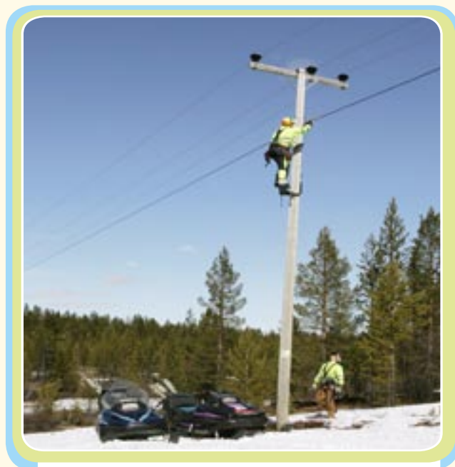
Bredband – en online-livlina för Sveriges mer avlägsna samhällen

Den sammanlagda kostnaden för projektet uppgick till 10,2 miljoner euro varav EU:s bidrag totalt motsvarade 4,5 miljoner euro.